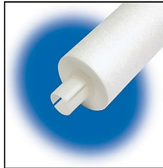
Extensor Central PP