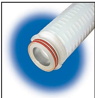
226 (c/insert inox)