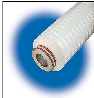
222 (c/insert inox)