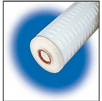
213 O-Ring interno