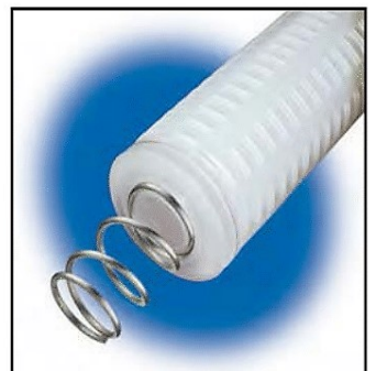
Mola compressão inox 316