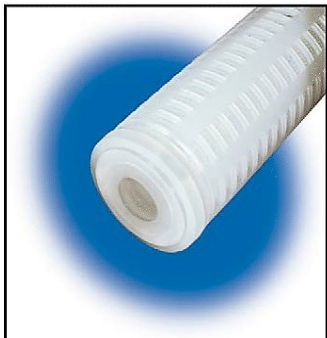
Plano (p/ 213)